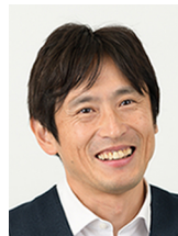
郡 宏 教授

生物には様々なリズムがあり、それらは細胞集団の同期によって作られている。我々の心臓や24時間の体内時計は細胞レベルの振動が集団で同期した活動をすることによって作動している。生き物の歩行や遊泳も、四肢や繊毛集団が特定の同期パターンを作ることによって実現する。本講義では私が携わってきた同期の研究の中でも、興味深い実験研究ができると期待している題材を中心に解説する。共同研究を始めるきっかけとなれば幸いである。