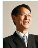
大矢 禎一 教授

Thus, our high-dimensional, single-cell phenotyping provides valuable information on the breeding of sake yeast, which will be useful for future studies of breeding strategies in other microorganisms.