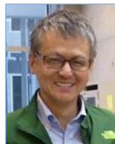
斎藤 馨 教授

「インターネットの先にある本物の自然」をテーマに、国内6カ所の森林に設置したカメラ、マイク、気象センサーからのデータをライブ配信しながら記録アーカイブ公開を進めている研究プロジェクト「サイバーフォレスト」について、デモンストレーションを含めて解説する。あわせてサイバーフォレストのデータを用いた森林の季節変化や経年変化に関する環境教育教材作成と小中高校での授業実践を通じた環境教育への活用事例を紹介する。