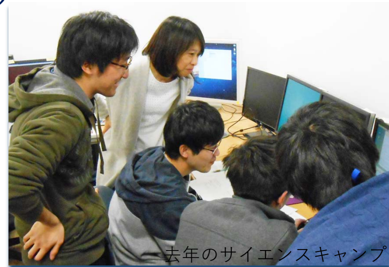
去年のサイエンスキャンプ