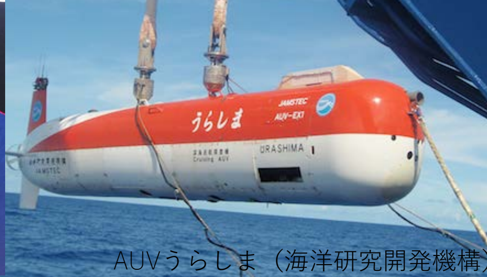
AUVうらしま (海洋研究開発機構)