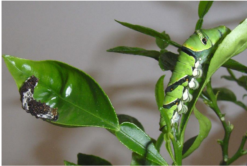
図1：ナミアゲハ ( Papilio xuthus ) の若齢幼虫（鳥の糞に擬態：左）と終齢幼虫（柑橘系の葉に擬態：右）